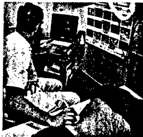
Überprüfung der Organ- lokalisation unter sonographischer Kontrolle.