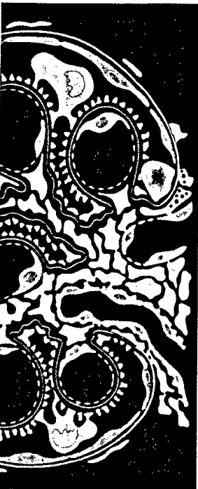
Titelbildvorlage: Glomerulus, Schemazeich- nung (siehe Seite 1235).