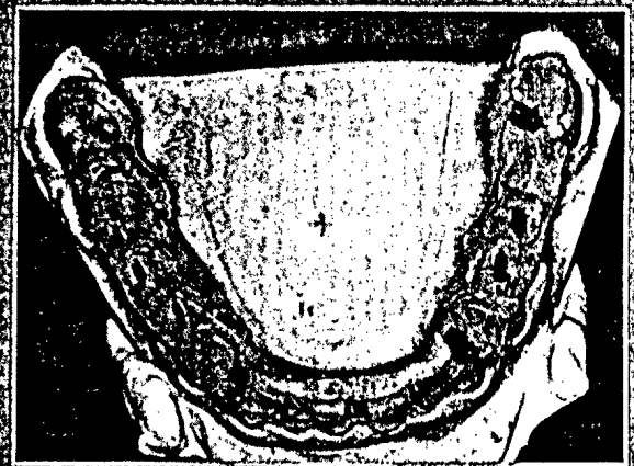
Die richtige Schiene für den Patienten 6