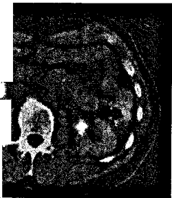
Was sehen Sie? (s. Mediquiz Seite 913).