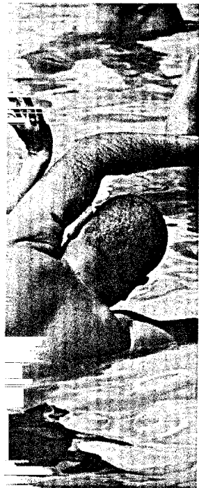
Titelbildvorlage: Symbolbild