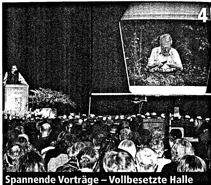
Spannende Vorträge – Vollbesetzte Halle

Abonnieren Sie unseren E-Mail-Newsletter über die Internetseite der GGB www.ggb-lahnstein.de oder schicken Sie eine E-Mail an: newsletter@ggb-lahnstein.de Dieser Service ist selbstverständlich kostenlos. Wir versichern, Ihre Mailadresse nicht an Dritte weiterzugeben!