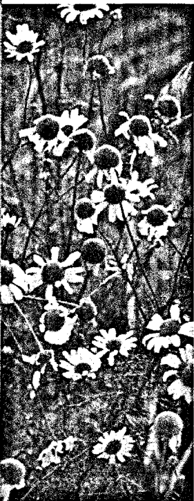
Titelbildvorlage: Kamille