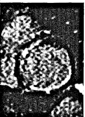
Was sehen Sie? (s. Mediquiz Seite 969).