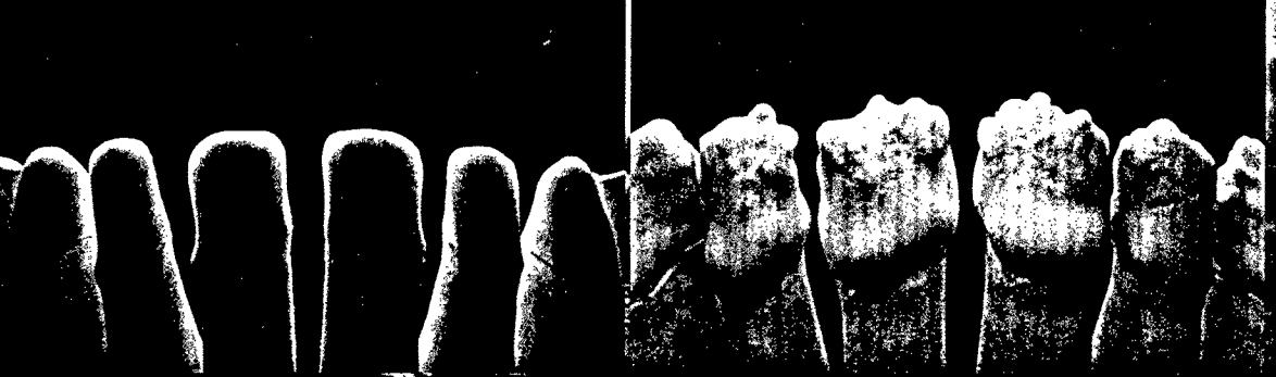
Vollkeramische OK-Frontzahneinzelkronen mit transluzenteren Zirkoniumdioxid-Gerüsten