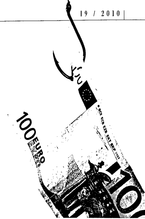
Positive Bilanz: Finanzielle Anreize für die Erforschung von Arzneimitteln für seltene Leiden zeigen Wirkung. Seite 24