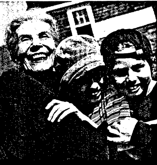
Demenzen vorbeugen: Präventiv wirken körperliche Aktivität, Gehirntraining und gute soziale Netze. Seite 34