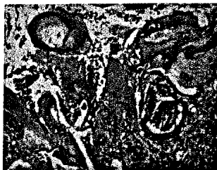
Titelbild: M. Vieth et al. aus Beitrag „Pseudoneoplastisches Regenerat epitel im Magen“