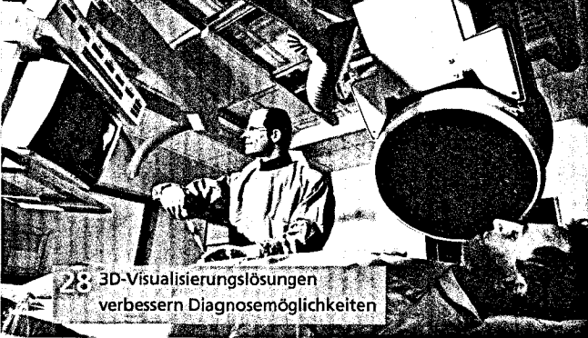
28 3D-Visualisierungslösungen verbessern Diagnosemöglichkeiten