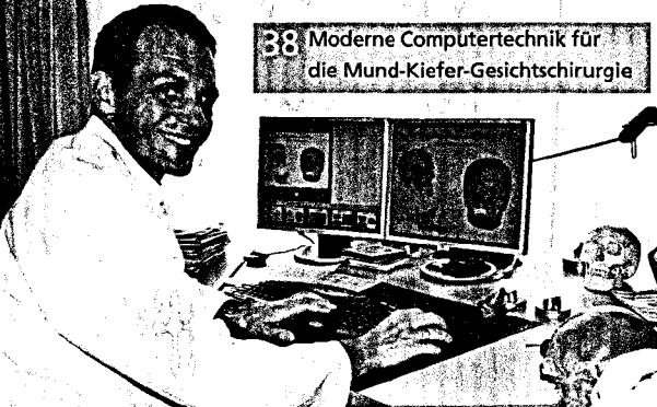
38 Moderne Computertechnik für die Mund-Kiefer-Gesichtschirurgie