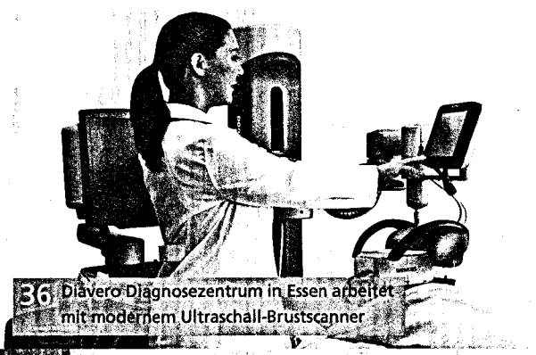
36 Diävero-Diagnosezentrum in Essen arbeitet mit modernem Ultraschall-Brustscanner