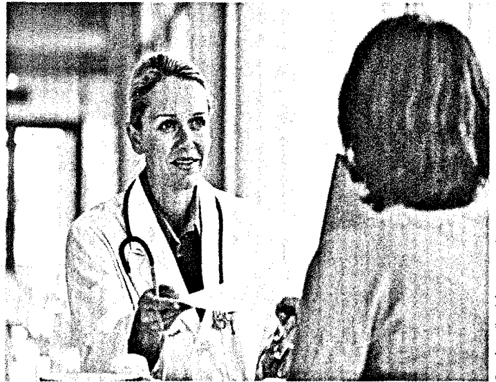
Viele Leistungen werden inzwischen aus Diabetes-Schwerpunktpraxen in den hausärztlichen Bereich verlagert ▶ Seite 90

diabetesDE. Status of the new German diabetes organization one year on T. Danne · D. Garlich