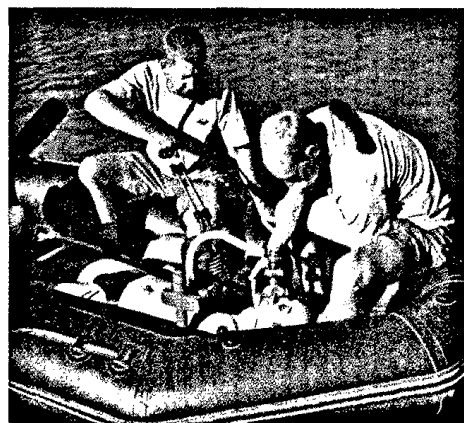
Auch in Extremsituationen muss eine best- mögliche Behandlung angestrebt werden. Die Technik hilft dabei.