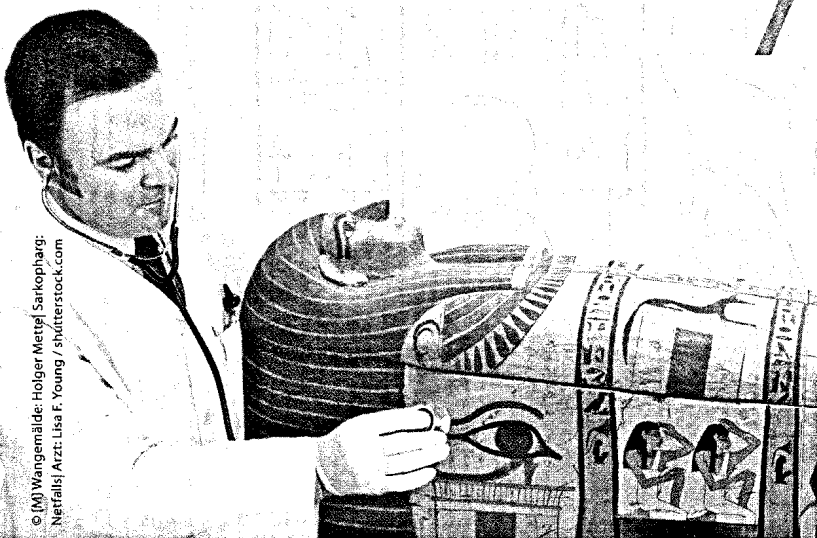
© [M] Wangemalde: Holger Metzel / Sarkophag; Netfalls | Arzt: Lisa F. Young / shutterstock.com