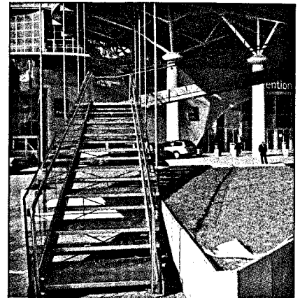
DGP-Kongress in Hannover