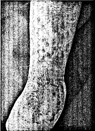
Durch Trichophyton interdigitale verursachte Tinea (S. 137).

April 2010 · Seite 109–156 · 36. Jahrgang