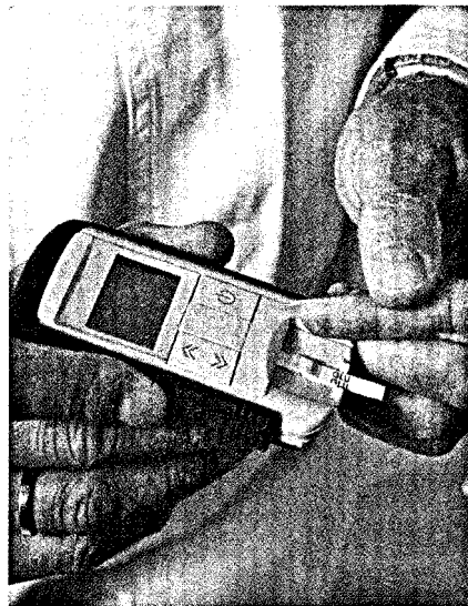
Teststreifen für Typ-2-Diabetiker ohne Insulintherapie sollen nicht mehr erstattet werden. Apothekern drohen Umsatzeinbußen. Seite 44