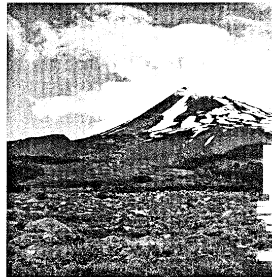
Ein Auslandsaufenthalt, zum Beispiel im Rahmen des PJ, erweitert in vielen Belangen den Horizont. Ein Erfahrungsbericht aus Chile. Seite 56