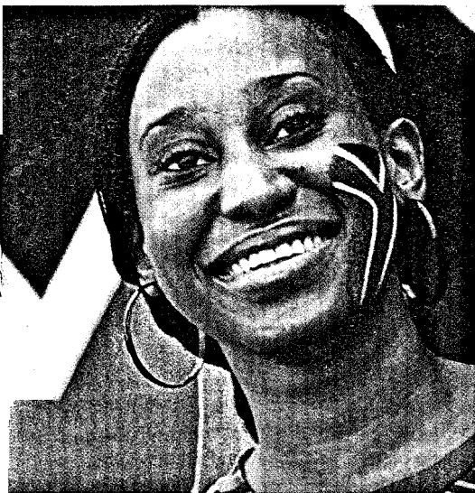
Im Juni beginnt in Südafrika die Fußball-WM. Besucher sollten sich auf die Reise auch in medizinischer Hinsicht gut vorbereiten. Seite 38