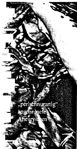
Rekonstruktion der supra-aortalen, extrakraniellen Gefäße vor dem vertebro-carotidealen Bypass (s. Seite 748).