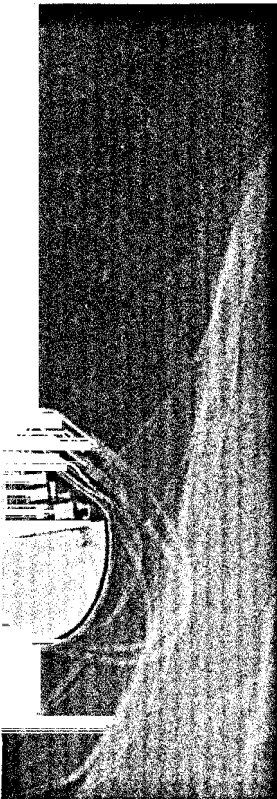
Titelbildvorlage: Herzschrittmacher