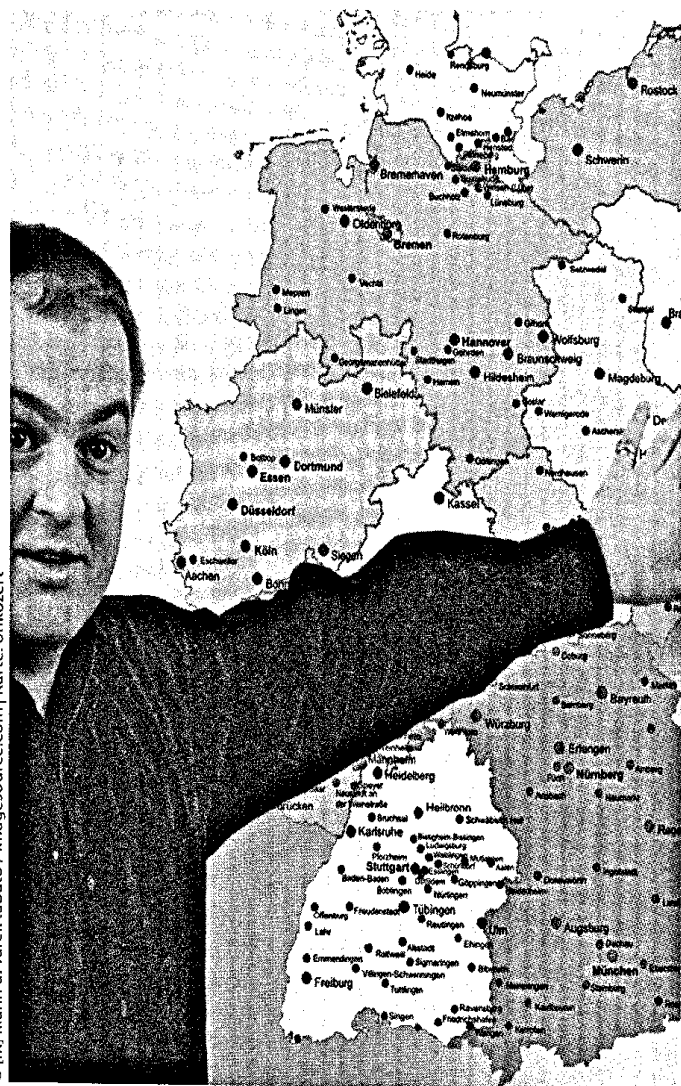
© [M] Mann u. Tafel: tabato / imagesource.com | Karte: onkozeit