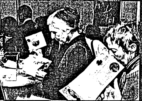
Filmpremiere „Die 2. Stimme“ in Berlin