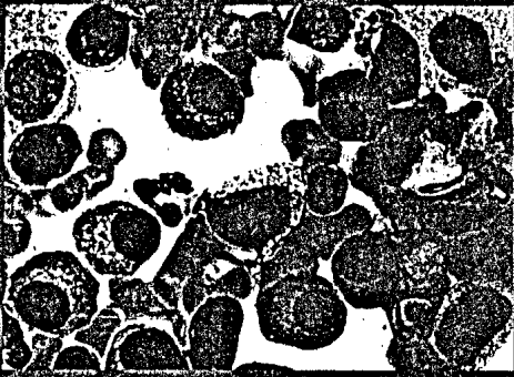
Multiples Myelom: Diagnostik und Therapie im Überblick