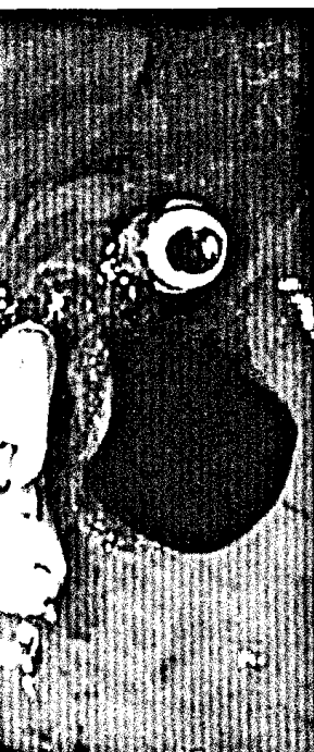
Titelbildvorlage: Blutstillung einer präpylorischen Ulkusblutung durch Clips (s. Seite 402).