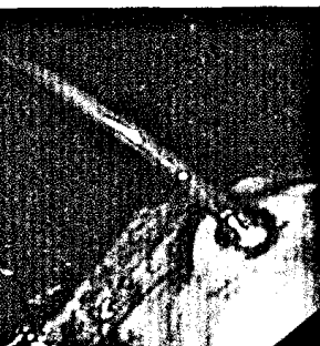
Spritzende Ösophagusvarizenblutung (s. Seite 405).