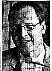
Zusatzstreit um Zusatzbeitrag 18, 20