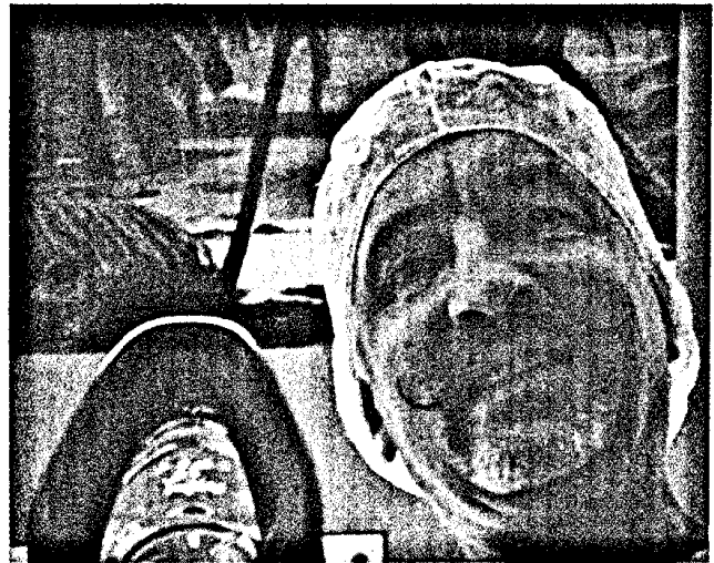
Ein Anästhesist kann dem Patienten auch freundlich lächelnd ohne Mundschutz von vorne gegenüberstehen