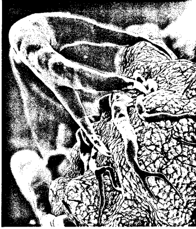
Ovarialkarzinom – bei der Gefäßversorgung ansetzen?