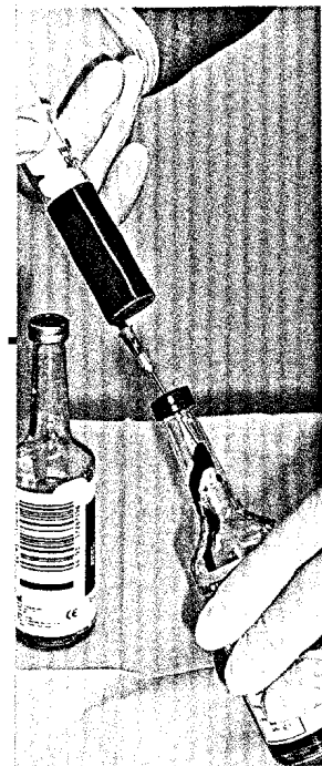
Titelbildvorlage: Befüllung der Blutkulturflasche (s. dieses Heft S. 357).