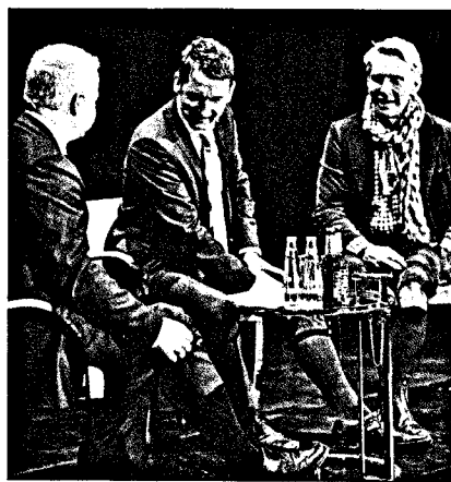
Das Thema Kompressionsstrümpfe aus der Tabuzone holen: Dazu treten mehrere Firmen mithilfe prominenter Promoter an.