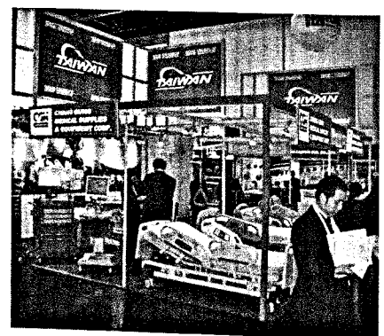
Taiwanische Produzenten wollen sich von Niedrigpreissegmenten absetzen und verstär- ken internationale Vertriebsanstrengungen.