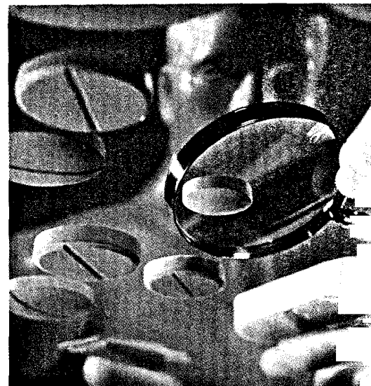
Ältere Menschen nehmen häufig mehrere Medikamente ein. Apotheker können zu ihrer Sicherheit den Überblick behalten. Seite 26