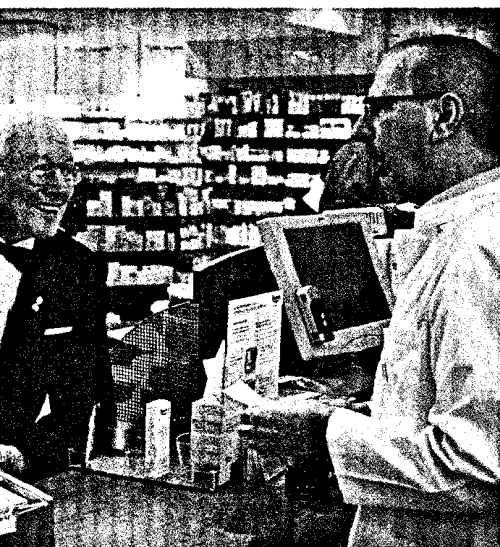
Senioren sind die wichtigste Zielgruppe der Apotheken und brauchen eine besondere Ansprache. Seite 6