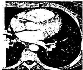
Titelbildvorlage: Unterschiedliche Läsionen im CT-Thorax bei pulmonaler Langerhanszell-Histiozytose (s. dieses Heft Seite 463).