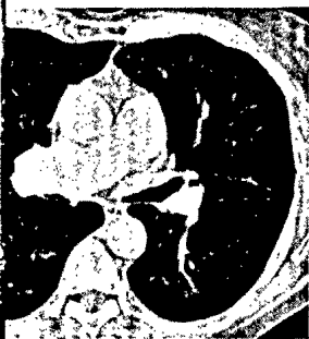
Was sehen Sie? (s. Mediquiz Seite 457).