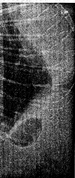
Röntgenbild der Wirbelsäule. Definierte Leitlinien für die Behandlung von Rückenschmerzen werden nur unzureichend umgesetzt.