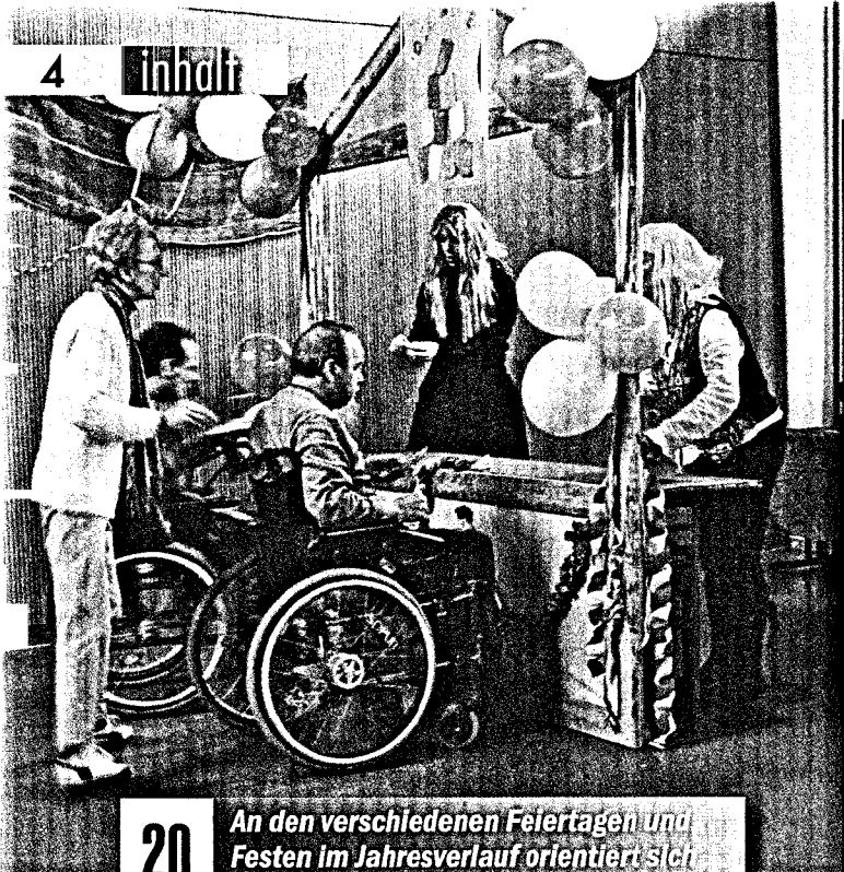
20 An den verschiedenen Feiertagen und Festen im Jahresverlauf orientiert sich das Behandlungskonzept Jahresuhr