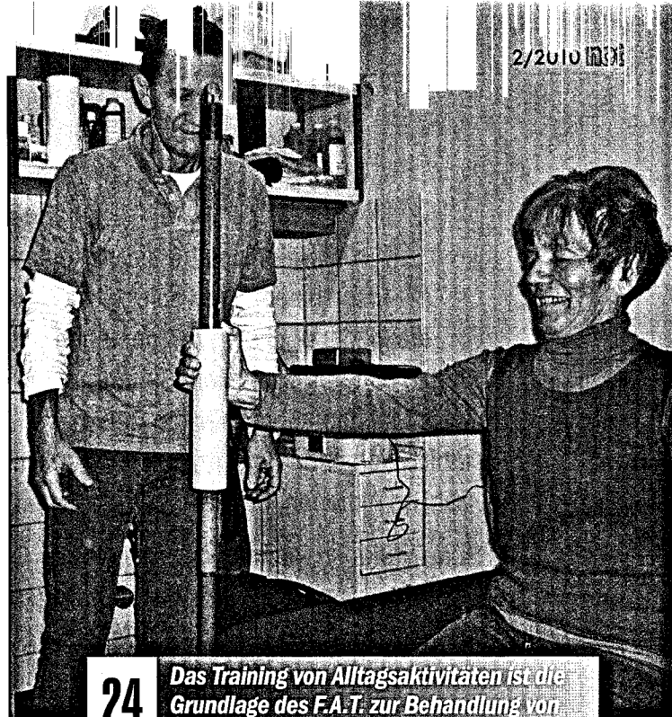
24 Das Training von Alltagsaktivitäten ist die Grundlage des F.A.T. zur Behandlung von Menschen mit zentralvenöser Schädigung