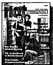
Zum Titel: In der Rehabilitation kommen zahlreiche Therapien zum Einsatz, wie hier das Gangtraining zur Behandlung von Geh- und Bewegungsstörungen.