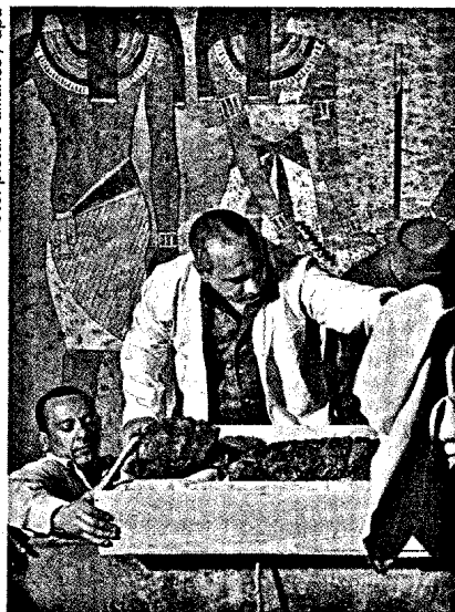
Forscher haben Tutanchamuns DNA analysiert – und die Krankheiten des Pharaos bestimmt.