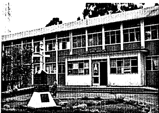
Machame-Hospital in Tansania.

20.000 Leserinnen und Leser sammelten über 50.000 Fortbildungspunkte mit dem „Bayerischen Ärzteblatt“.