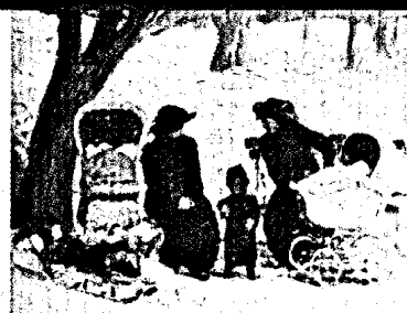
George Benjamin Luks Nursemaids

Bildbetrachtung auf Seite 76 dieser Ausgabe