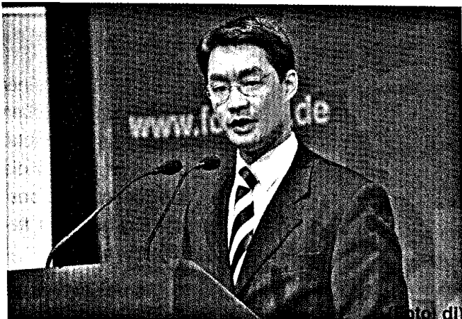
8 Der Bundesgesundheitsminister auf dem FDP-Jahresempfang in Kiel.