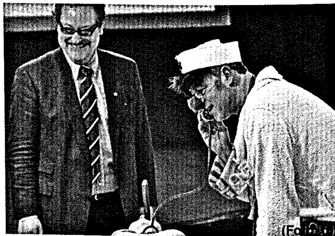
10 Vernetzte Gesundheit wurde auf dem Patiententag des Kongresses in Kiel mit Humor begleitet.