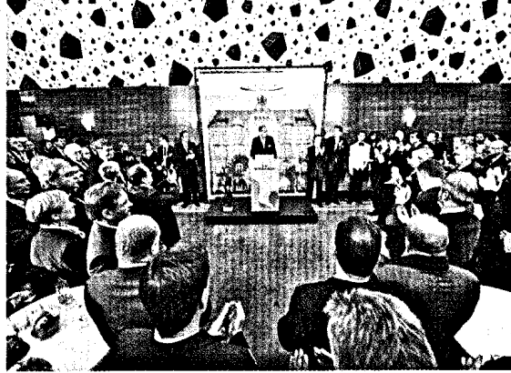
Über 400 Gäste kamen zum Neujahrsempfang von BZAK und KZBV, darunter viele neue Köpfe aus der Politik.