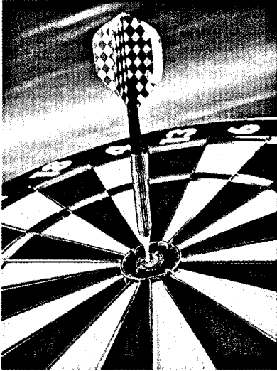
Forum gesundheitsziele.de: Auf der Konferenz 2010 wurde nach neun Jahren Arbeit Bilanz gezogen.