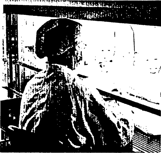
Die AOK Berlin-Brandenburg hat die Versorgung ihrer Versicherten mit parenteralen Zytostatikarezepturen ausgeschrieben. Seite 6