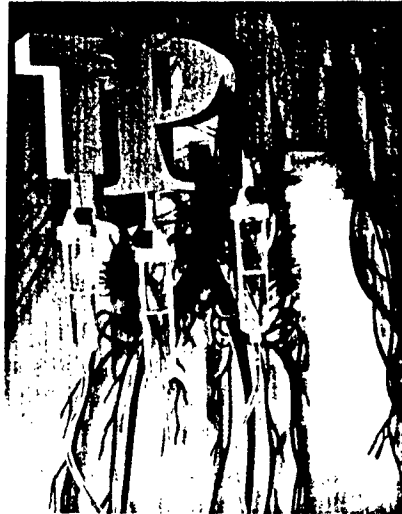
Wenn die Zufuhr über den Magen-Darm-Trakt nicht mehr möglich ist, bietet die parenterale Ernährung einen Ausweg. Seite 16