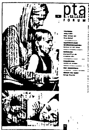
In dieser Ausgabe finden Sie das Supplement PTA-Forum 1/2010.