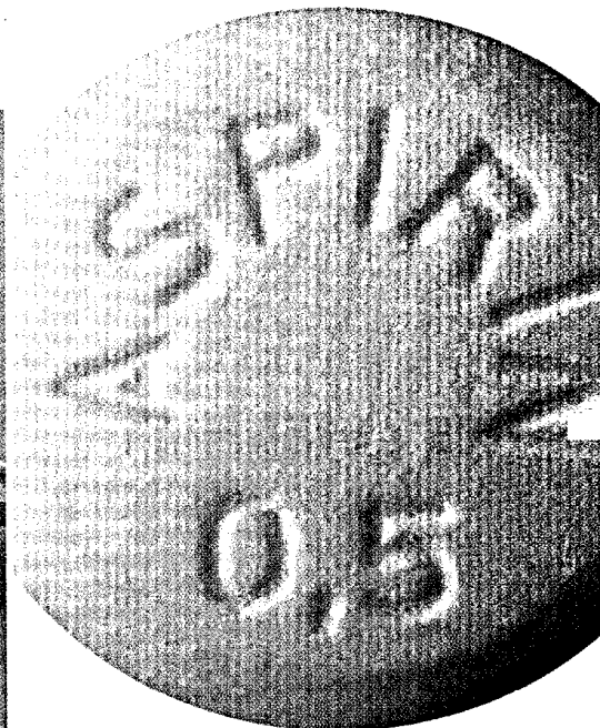
ASS könnte in seiner über 100-jährigen Geschichte zum ersten Mal verschreibungspflichtig werden. Seite 24