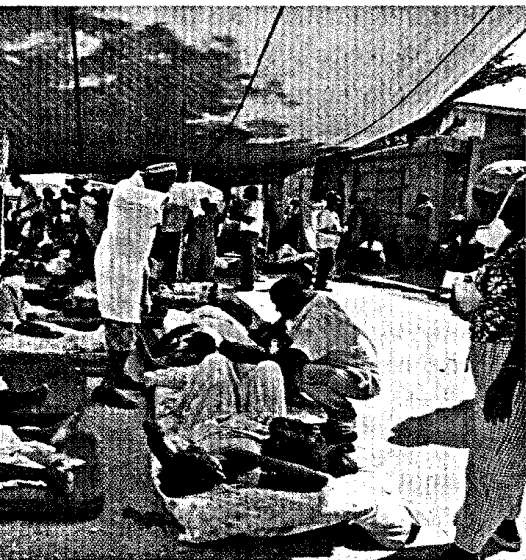
Gemeinsam mit anderen Hilfsorganisationen kümmern sich Apotheker um die medizinische Versorgung der Erdbebenopfer. Seite 6