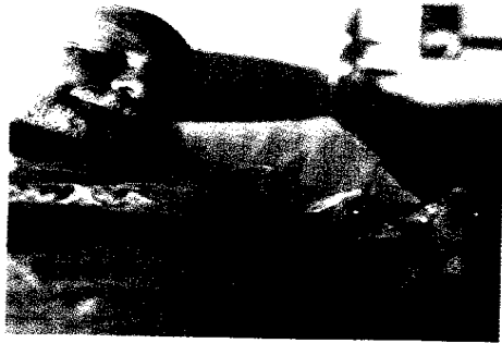
Radikale Prostatektomie: Sind Laparoskopie und offene OP vergleichbar? (S. 346)