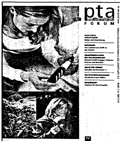
In dieser Ausgabe finden Sie das Supplement PTA-Forum 11/2010.

Gefahrstoffrecht Neue Regelungen in der Apotheke