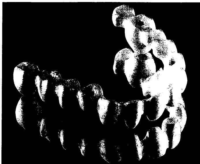
Sascha Cramer beschreibt in seinem reich bebilderten Artikel den Weg vom Zirkonsand zur High-End-Keramik ab Seite 79