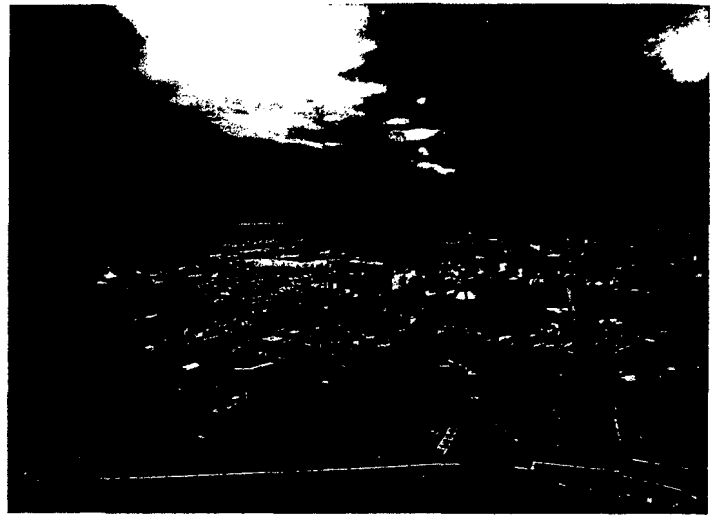
In Spanien lässt es sich trefflich Urlaub machen. Wie es ist, dort als Zahntechniker zu arbeiten, erfahren Sie ab Seite 646