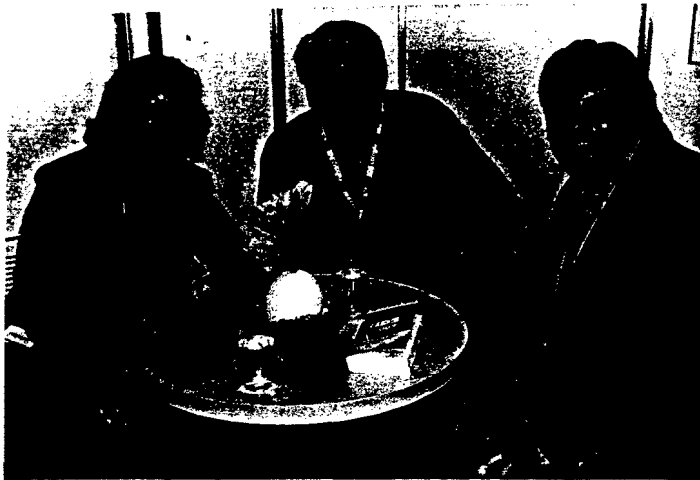
Köln war fünf Tage lang der Nabel der Dental-Welt: Impressionen von der IDS auf den Seiten 640 und 644 sowie in unserem großen Special, das dieser Ausgabe beiliegt