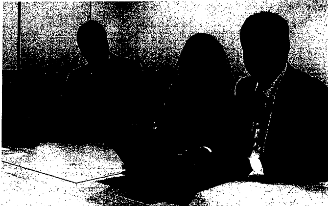
Über neue Produkte und Strategien von Nobel Biocare informierte sich „das dental labor“ bei einem Besuch in Stockholm. Ab Seite 484