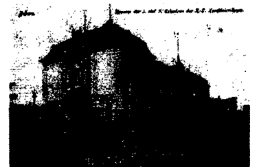
Die Bornasche Krankheit Seite 70