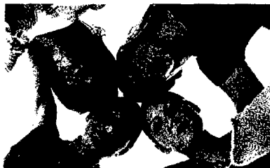
Disorders of Pubertal Development Jürgen Brämswig, Angelika Dübbers