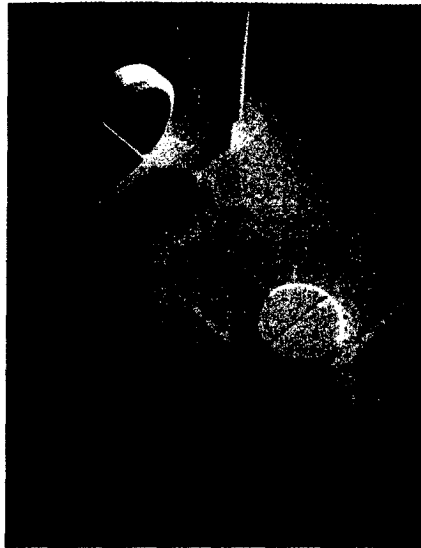
Medikamente können die Lichtempfindlichkeit der Haut krankhaft steigern. Seite 24