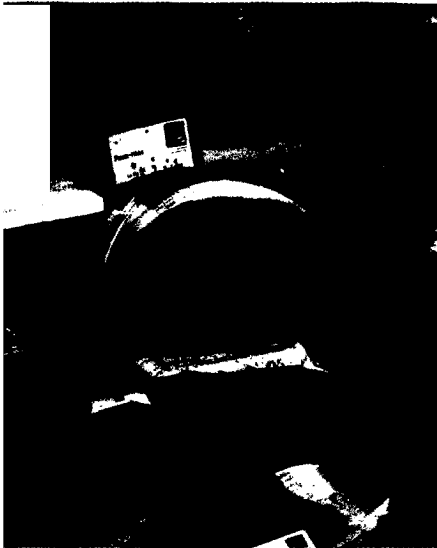
Methicillin-resistente Staphylococci (MRSA) gefährden die Gesundheit und gelangen auch in Lebensmittel. Seite 42