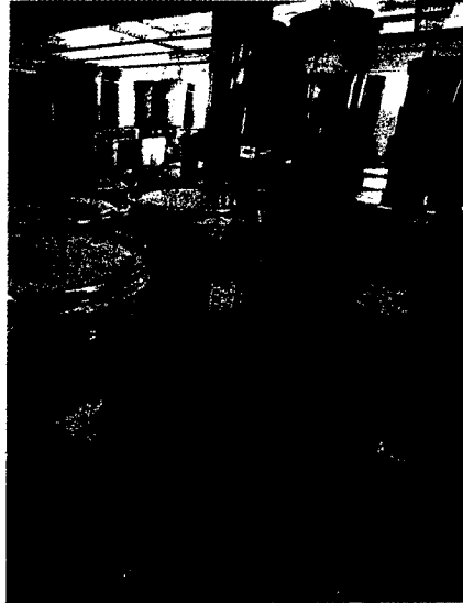
Als Reaktion auf die Schweinegrippe steigern Pharmaunternehmen die Produktion ihrer antiviralen Medikamente. Seite 48