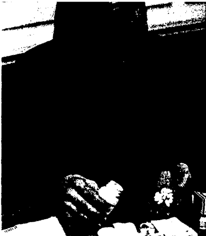
Die meisten Tablettensüchtigen sind von Benzodiazepinen abhängig. Wie Apotheker ihnen helfen können, lesen Sie auf Seite 40.