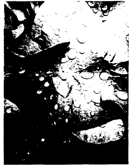
Hortensien gehören zu den Naturdrogen. Den blauen doldenartigen Blüten wird eine berauschende Wirkung nachgesagt. Seite 24