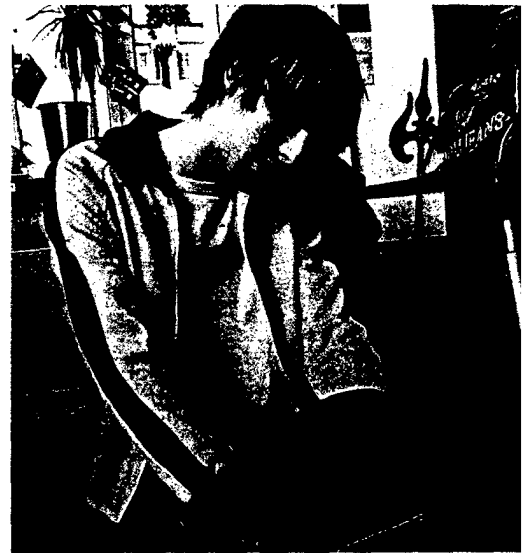
Das Bildungszentrum Hermann Hesse (BZH) gibt Süchtigen die Chance, Schulabschlüsse nachzuholen. Seite 50