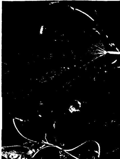
Cannabis ist nicht so harmlos, wie viele denken: Der Konsum kann zu psychischen Störungen wie Schizophrenie führen. Seite 34