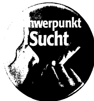
Die Beiträge sind im Heft durch das Logo und im Inhalt durch gekennzeichnet.