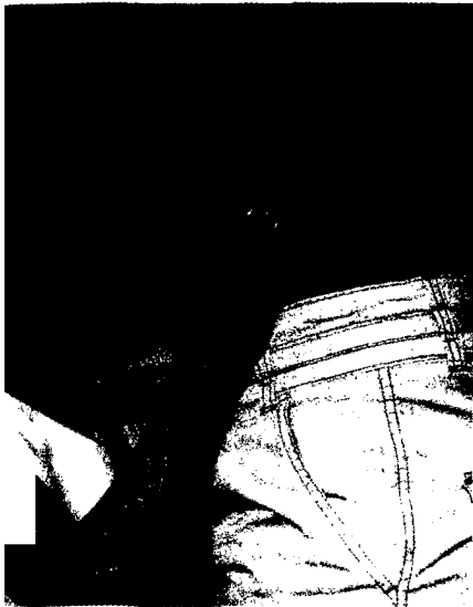
Zu kaum einem Zeitpunkt legen Frauen so viel Wert auf ihre Ernährung wie in der Schwangerschaft. Was dabei zu beachten ist. Seite 34