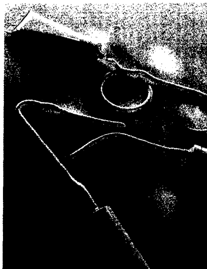
In der Medizin werden silberhaltige Präparate vor allem zur Wundbehandlung genutzt. Seite 14