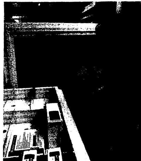
Stichprobenartige Überprüfung von Fertigarzneimitteln: Die AMK appelliert an die Meldebereitschaft der Apotheker. Seite 22