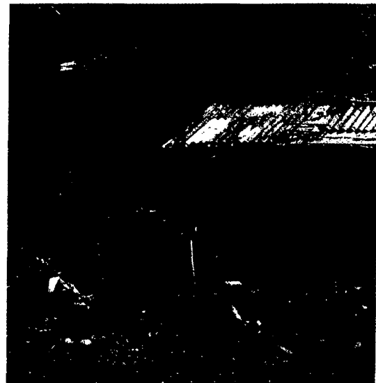
Große Herausforderung: Pharmazeuten von Apotheker ohne Grenzen helfen im Elendsviertel von Buenos Aires. Seite 48