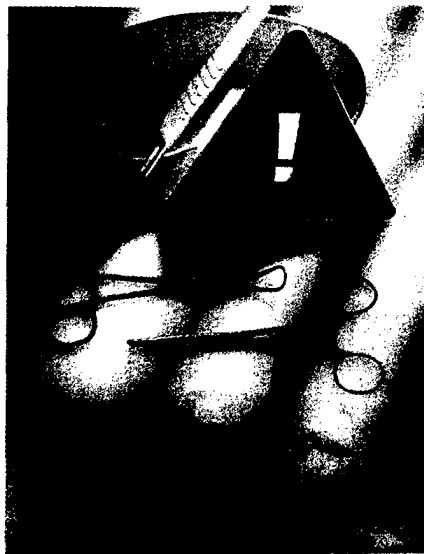
Wie wahrscheinlich ist eine Infektion mit MRSA und welche Schutzmaßnahmen sind nötig? Seite 14