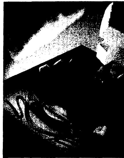
Diabetische Retinopathie: Candesartan könnte ein neuer Kandidat für Therapie und Prävention sein. Seite 22