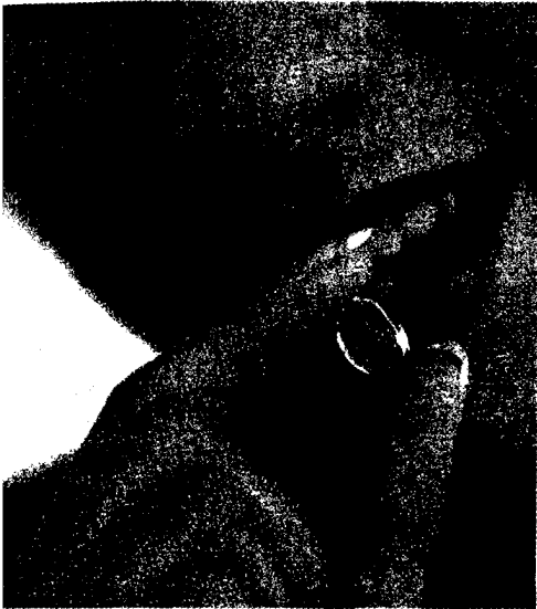
Kapsel für die Gesundheit: Welche Nahrungsergänzungsmittel sinnvoll sind und welche nicht, lesen Sie ab Seite 32.