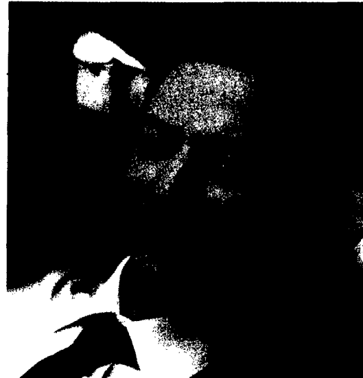
Plädiert für mehr Humor: Dr. Eckhart von Hirschhausen über die Rolle des Arztes, Gesundheit und Lebensinn. Seite 52