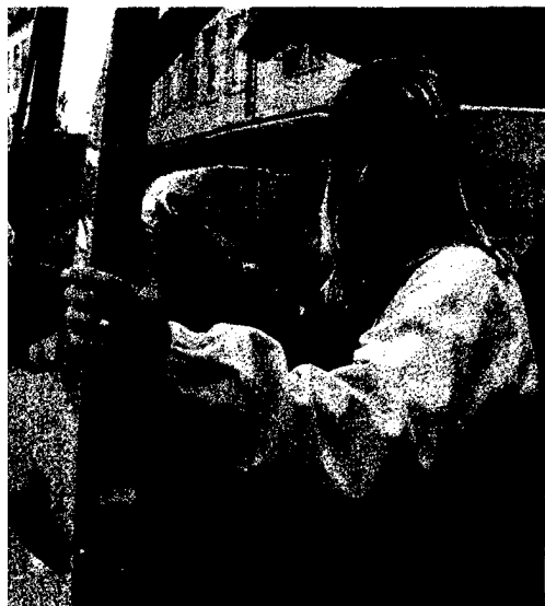
Das Meinungsbild der Verbände im Gesundheitswesen zum Versandhandel ist gespalten. Seite 6