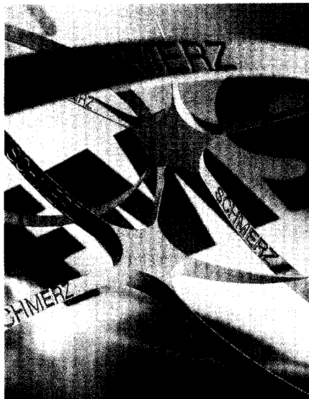
Fibromyalgie-Syndrom: Erstmals von medizinischen Fachgesellschaften in Deutschland als Krankheitsbild anerkannt. Seite 16