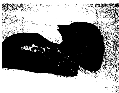
Resektionspräparat Segmente 6 und 7 der Leber mit Aktinomyzotom, das eine seltene Erkrankung darstellt. Seite 168