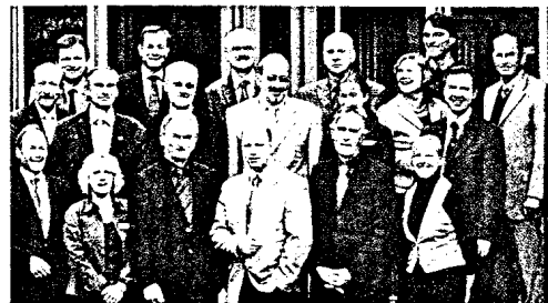
Fort- und Weiterbildung für Zahnärzte und Mitarbeiterinnen im Wandel Bestandsaufnahme und neue Herausforderungen