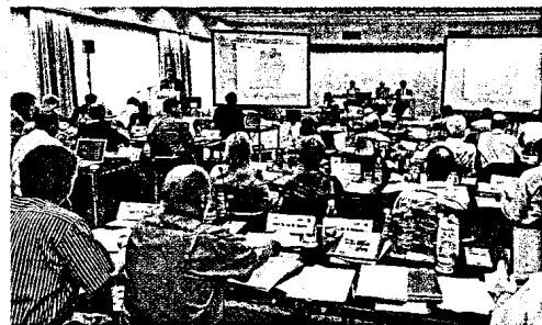
Selbstverwaltung aktiv: Kommunikation und Öffentlichkeitsarbeit Passgenau für die Zielgruppen