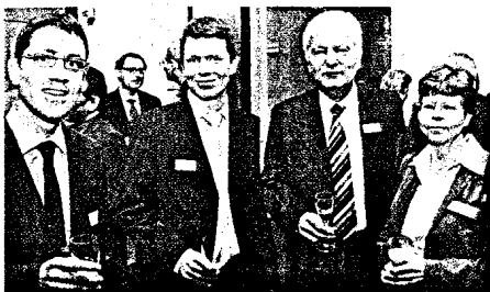
Neujahrsempfang der BZK Stuttgart Mit Kraft und Herzblut Herausforderungen begegnen