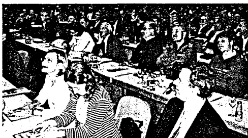
Selbstverwaltung aktiv: Gemeinsame landesweite Gutachtertagung Angleichung der Spruchpraxis