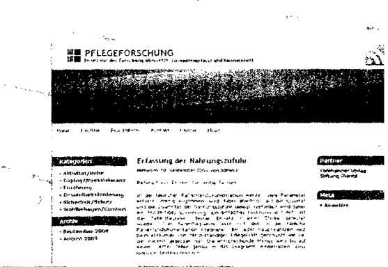
1100 Weblog: Der Beitrag stellt ein aktuelles pflegewissenschaftliches Projekt an der Charité Universitätsmedizin Berlin vor. Er wurde ein Weblog entwickelt, um den Theorie-Praxis-Transfer zu unterstützen. Nach der Pilotphase ist geplant, die Seite im Frühjahr 2010 auch öffentlich zugänglich zu machen.

WEBLOG: Der Beitrag stellt ein aktuelles pflegewissenschaftliches Projekt an der Charité Universitätsmedizin Berlin vor. Er wurde ein Weblog entwickelt, um den Theorie-Praxis-Transfer zu unterstützen. Nach der Pilotphase ist geplant, die Seite im Frühjahr 2010 auch öffentlich zugänglich zu machen.