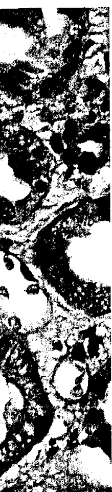
Titelbildvorlage: Röntgenographie-gesteuerte Nierenbiopsie (DMW Falldatenbank S. 2231).