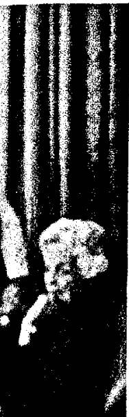
Versorgung zuhause älteren Patienten.